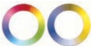
Farbsehen bei Mensch und Pferd: Der linke Kreis zeigt die Farben, die der Mensch sieht, der rechte das eingeschränkte Farbspektrum des Pferdes: Blau-, Gelb- und Grautöne.