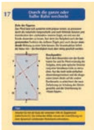
Vorderseite Karten 16 bis 30